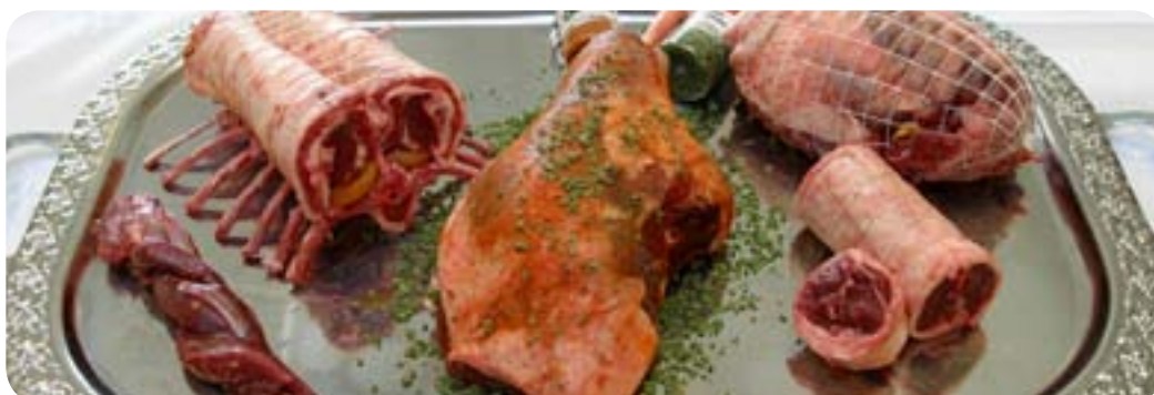
Lammekød fra Island, fotograf Askell Thorisson.