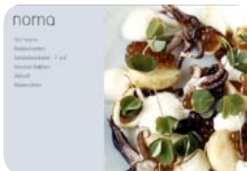
Exempel på webbsidor på Internet, som skulle kunna nås via en nordisk matportal – ett Nordiskt Virtuellt Mathus.

Slutrapport: www.nynordiskmad.org/prosjekter