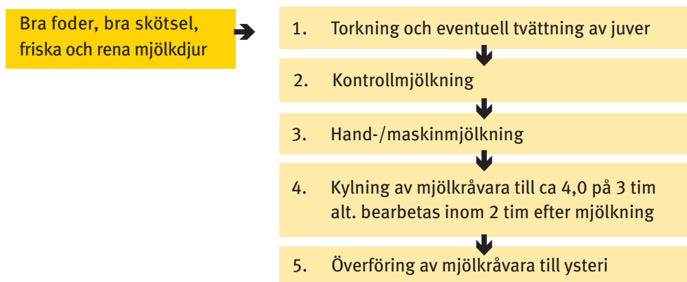
Figur 1. Exempel på flödes-schema för mjölkning

Med hjälp av flödesscheman får man en bra bild av alla moment i produktionen/tillverkningen. I schemat kan både temperatur, tidsperiod och identifierade kritiska styrpunkter markeras. Figur 1 visar exempel på ett flödesschema för mjölkning.