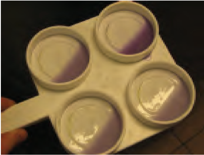
Bild 6. CMT-test på mjölk

Korrigerande åtgärd är att inte använda mjölk från dessa djur till produktion av ost. Vid ystning av opastöriserad mjölk bör ystningen anpassas till att det kan finnas problem med Staphylococcus aureus ( S. aureus ) i mjölken. Detta kan ske genom följande åtgärder, vilka även beskrivs i bilaga 8 ”Forekomst og forebygging av uønska mikroorganismer og fremmedstoffer i småskala mjölkeforedling i Norge” 51 :