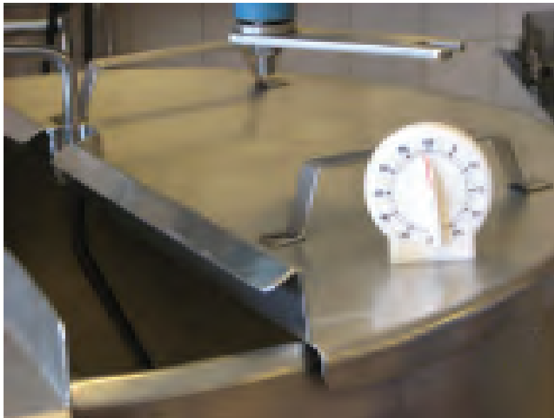
Bild 4. Syring under ystning

Exempel på hur ett kontrollkort vid tillverkning av ost vid grytpastörisering kan se ut