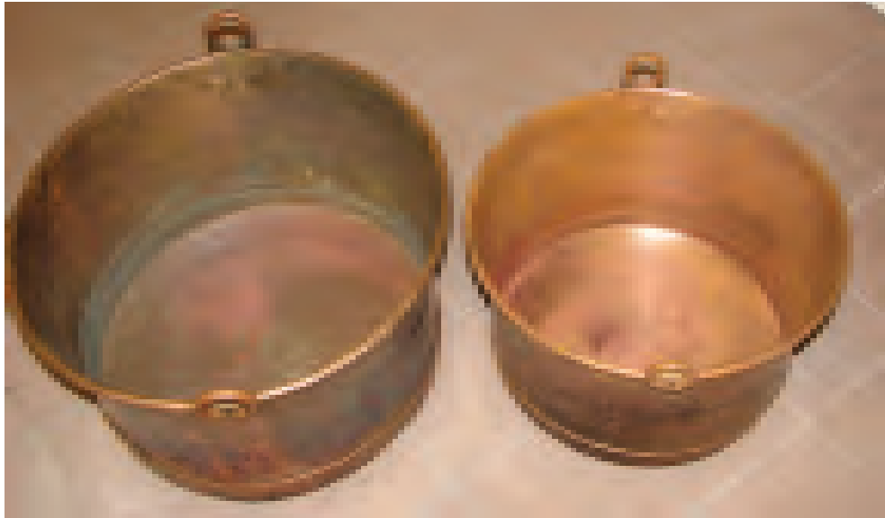
Bild 7. Kopparkärl före och efter rengöring