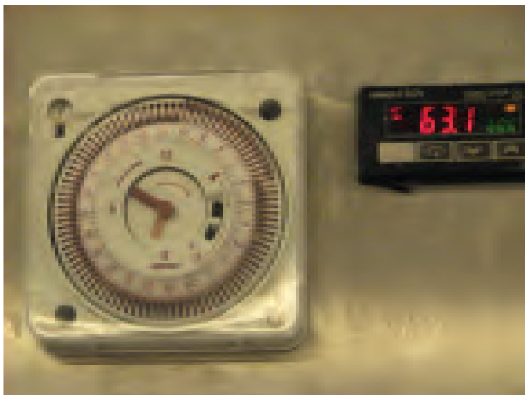
Bild 3. Pastörisering

För att få en säker produkt, men samtidigt inte förlora ystbarheten hos mjölken, är det viktigt att hålla sig till dessa tider och temperaturer. Otillräcklig tid och temperatur ger ofullständig avdödning av mikroorganismer. För lång tid och för hög temperatur förstör för mycket av mjölkens proteiner och dess ystningsegenskaper försämras. Detta kan innebära dräneringsproblem, som i sin tur ger blöta ostar och mikrobiella risker.