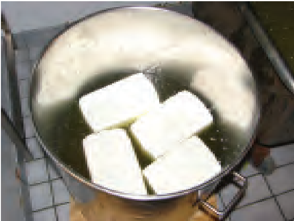
Bild 2. Saltning av ost i saltlake

Genom att välja torrsaltning minimeras risken för återkontaminering, men det är svårare att få bra resultat på stora ostar, vilket i sin tur kan ge en sämre produkt – både smakmässigt och hygienmässigt, eftersom saltet i sig hjälper till att sänka vattenaktiviteten i osten.